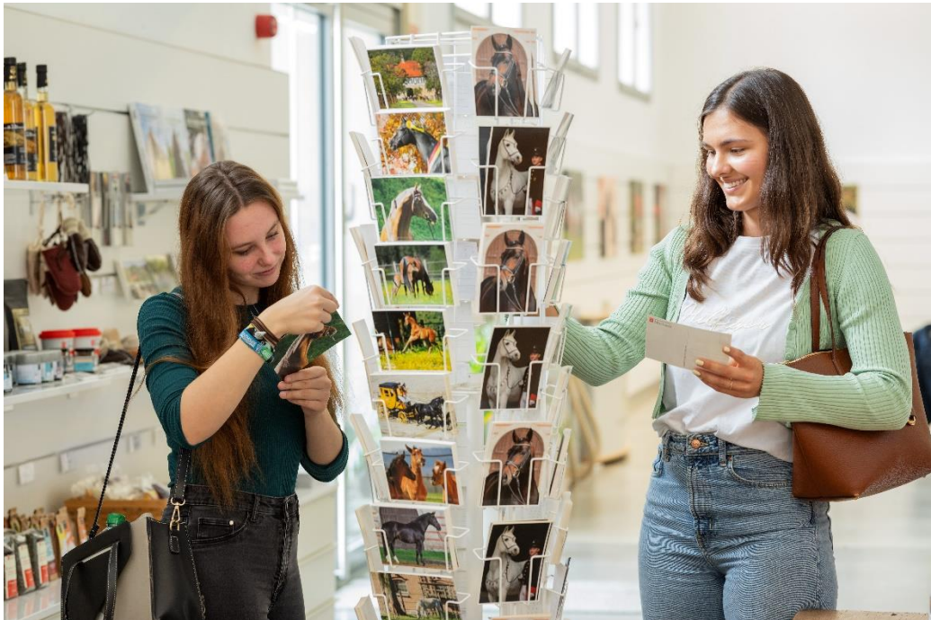
Im Gestüts-Shop erwarten die Besucher Souvenirs, Pferdeartikel und vieles mehr

Immer up-to-date darüber sein, was in Marbach los ist: Auf Facebook und Instagram können Pferdebegeisterte die Fohlen beim Aufwachsen begleiten, sowie Neuigkeiten rund um das Gestüt erfahren.